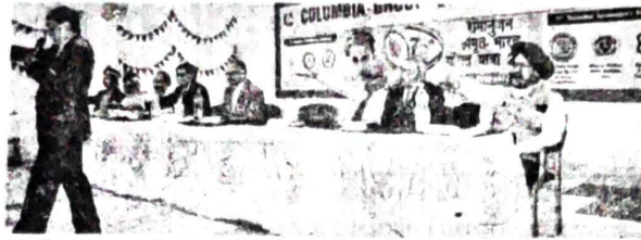
कोलंबिया ग्रुप आफ इंस्टीट्यूट में मंचस्थ अतिथिगण।

रायपुर (नई दुनिया प्रतिनिधि)। कोलंबिया ग्रुप आफ इंस्टीट्यूट में मंगलवार को रामानुजन अमृत गणित यात्रा का स्वागत किया गया। भारत की आजादी का अमृत महोत्सव मनाने के लिए महान गणितज्ञ रामानुजन के प्रति अपना सम्मान और कृतज्ञता दिखाने के लिए और छात्रों के लिए गणित और विज्ञान की शिक्षा को आसान बनाने के लिए यह यात्रा निकाली जा रही है। इस अवसर पर कोलंबिया स्कूल के छात्रों ने